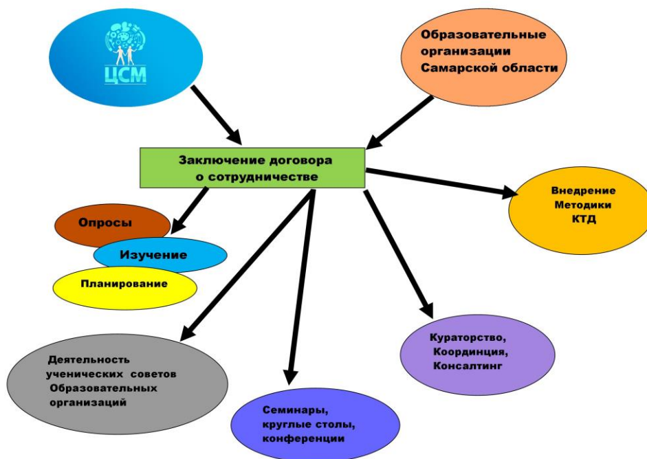
Рис. Схема организации деятельности по программе с конкретными образовательными организациями по реализации программы содействия развитию самоуправления.

Программа «За ученические советы» выстраивает свои взаимоотношения с образовательными организациями в соответствии со следующей схемой: